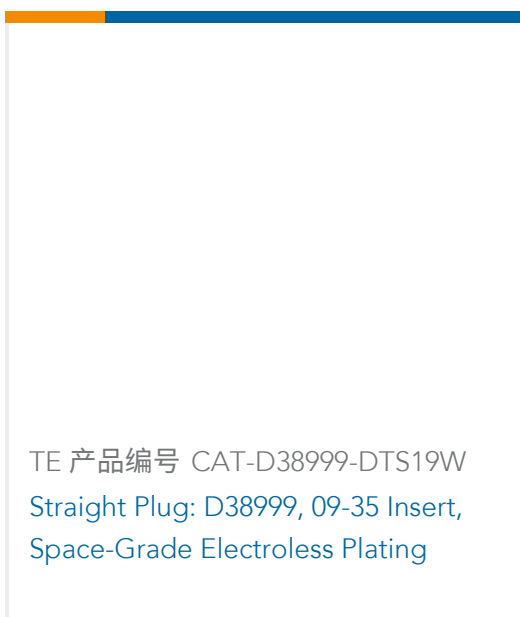
TE 产品编号 CAT-D38999-DTS19W Straight Plug: D38999, 09-35 Insert, Space-Grade Electroless Plating