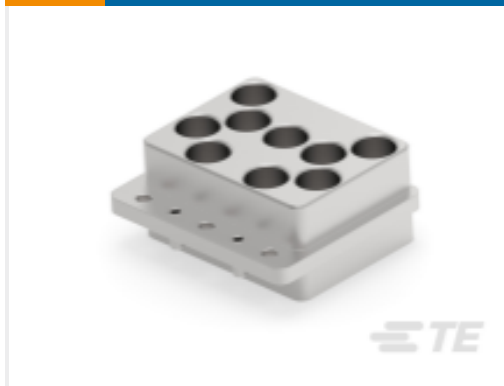
TE 产品编号2365211-1 MOD 9 POS SMPM VITA 67-3 TYPE A BP