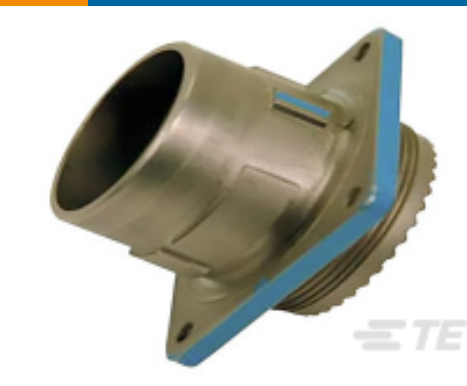
TE 产品编号YDIV46E23-35PAC009 PLUG ASSY