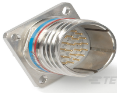
TE 产品编号YDTS20F19-35SNV001 RECP ASSY