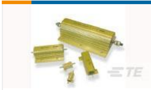
TE 产品编号2-1625984-1 HSA50 1R0 1%