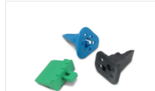
TE 产品编号CAT-D487-W416 WedgeLocks: DEUTSCH DT