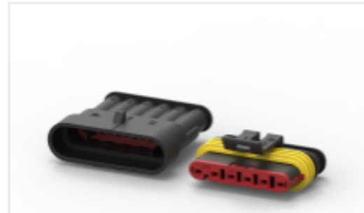
TE 产品编号CAT-AM71-CH8172 AMP SUPERSEAL 1.5MM, 连接器壳体