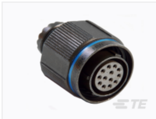
TE 产品编号 CAT-D38999-DTS19N Straight Plug: D38999, 25-04 Insert, Electroless Nickel Plating