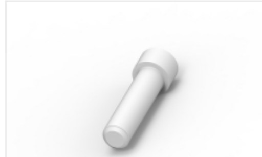
TE 产品编号114017-ZZ SEALING PLUG, SIZE 12/16, WHT