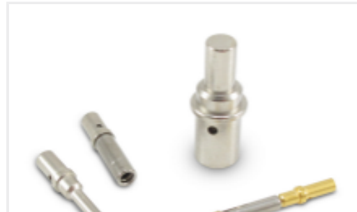
TE 产品编号CAT-D48-ST273 DEUTSCH Solid Contacts