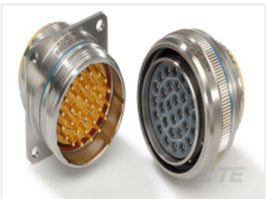
TE 产品编号ZPF0000000000007174 983-0RS 08-98 PN