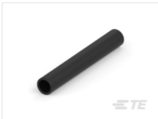
TE 产品编号CAT-HST-BSTS BSTS/BSTS-FR 热缩管