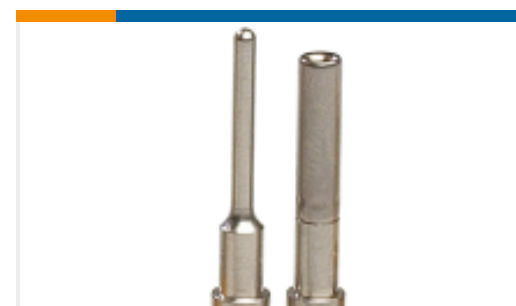
TE 产品编号ZPF0000000000001261 097-0267-16 A1267