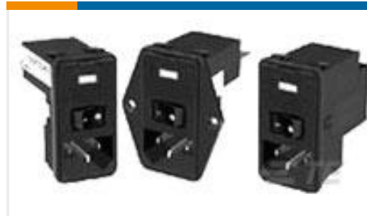
TE 产品编号2-6609107-0 PS0SXS60=C1048