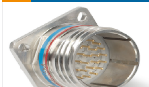
TE 产品编号YDTS20F09-98SNV001 RECP ASSY