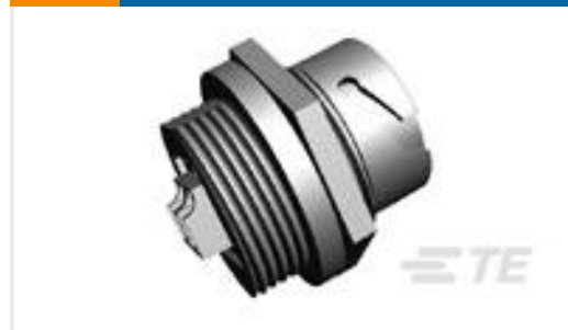
TE 产品编号1828619-2 Kit, Receptacle, LC, SM,ODVA