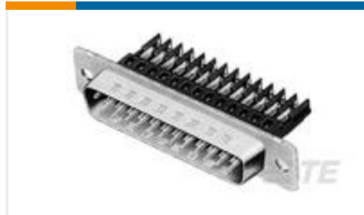
TE 产品编号1-745498-6 PLUG ASSY,37P,HDE,MS