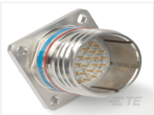
TE 产品编号CAT-D38999-DTS7M Square Flange Receptacle, 25-43 Insert, D38999