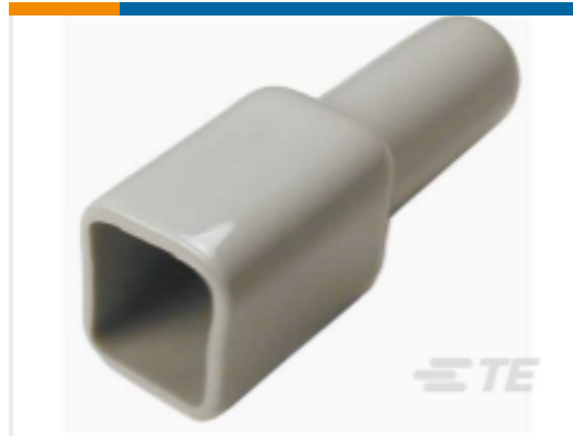
TE 产品编号DT4P-BT BOOT, 4P, REC, ST, GRY