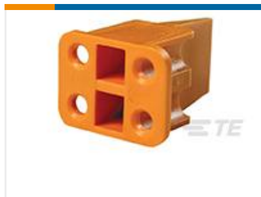
TE 产品编号WP-4S WEDGE LOCK, 4P, PLG, ORG, DTP