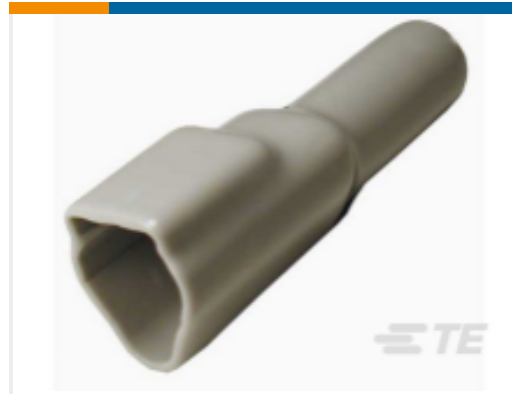
TE 产品编号DT3P-BT BOOT, 3P, REC, ST, GRY