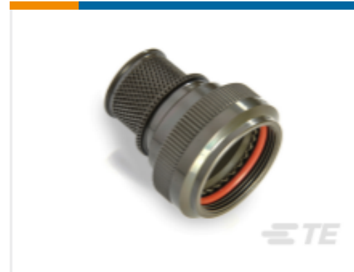
TE 产品编号EK4825-000 91H1-09-04-1-C-HE050