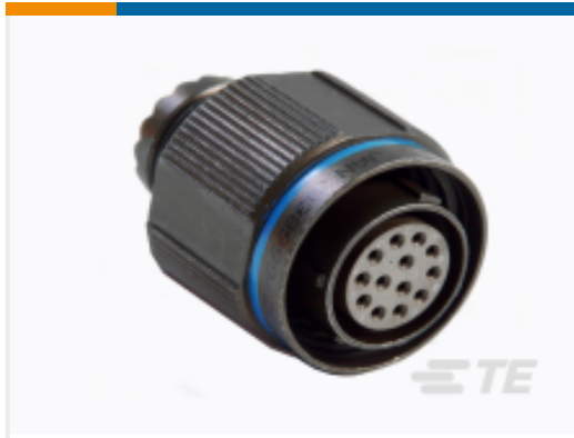
TE 产品编号YDTS26F17-26PAV001 Straight Plug: D38999, 17-26 Insert, Electroless Nickel Plating