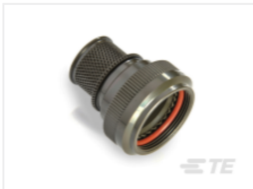
TE 产品编号EK4825-000 91H1-09-04-1-C-HE050