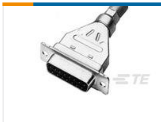
TE 产品编号1658651-1 KIT,HDP-20,OVRMLD,RCPT,SIZE 4,