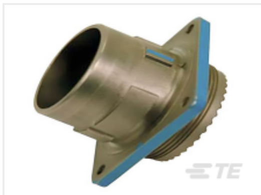
TE 产品编号YDIV40E21-41SNC009 RECP ASSY