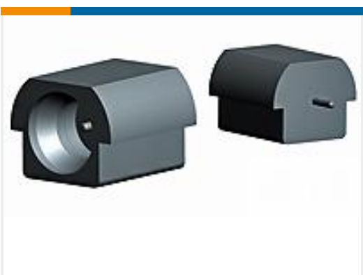
TE 产品编号1757640-2 SMPM MALE, PCB EDGE MOUNT, SMOOTH BORE