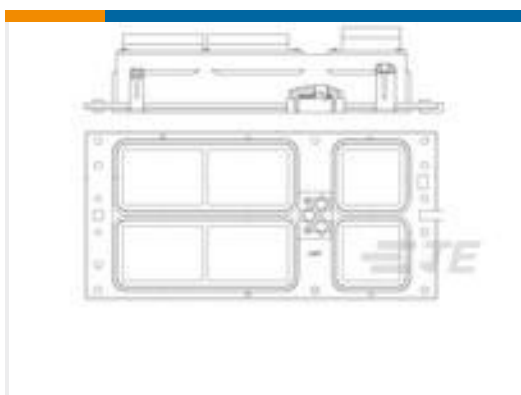
TE 产品编号1-211992-4 RECEPT ASSY,SZ 3,ARINC 600