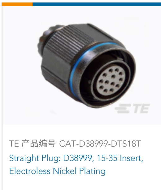
TE 产品编号 CAT-D38999-DTS18T Straight Plug: D38999, 15-35 Insert, Electroless Nickel Plating