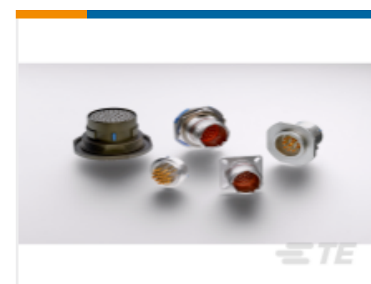
TE 产品编号YDTS20Y13-98XNV001 HERM RECP