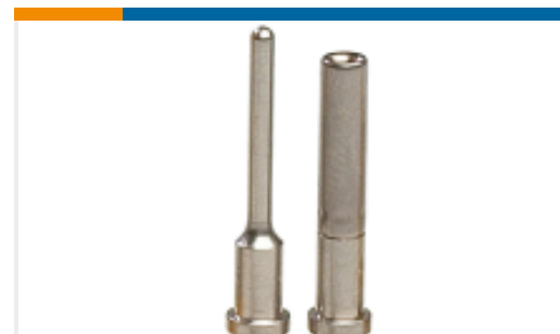
TE 产品编号ZPF000000000001261 097-0267-16 A1267