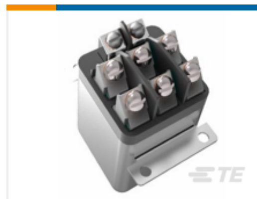
TE 产品编号1617807-5 FC-335-SY8= RELAY, 3PST