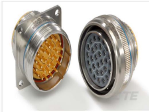
TE 产品编号 ZPF000000000007174 983-ORS 08-98 PN