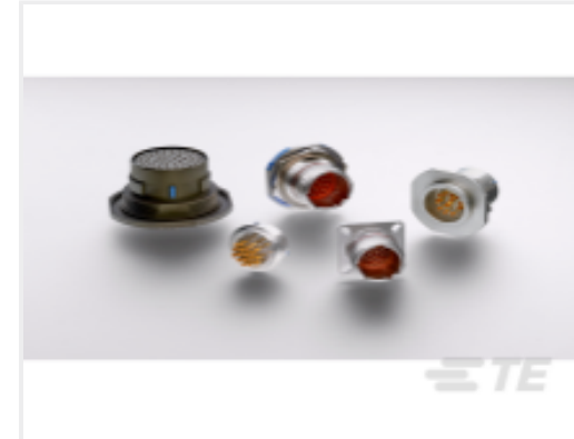
TE 产品编号 YDTS20Y13-98XNV001 HERM RECIP