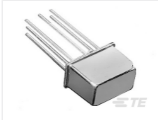
TE 产品编号 1617147-5 JMGAP-26P = M39016/17-030P