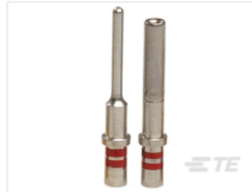
TE 产品编号 ZPF000000000001261 097-0267-16 A1267