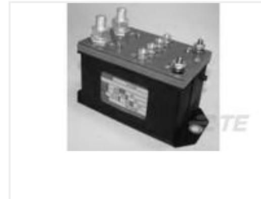
TE 产品编号 1616058-6 A703CD (FAA/PMA)=RELAY