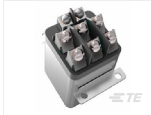
TE 产品编号 1617807-5 FC-335-SY8=RELAY, 3PST