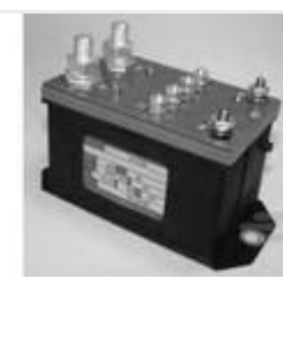
TE 产品编号 1616058-6 A703CD (FAA/PMA)=RELAY