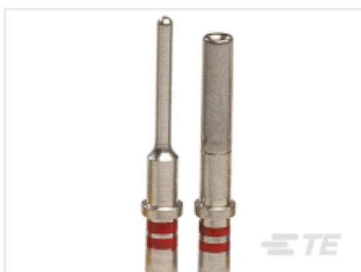
TE 产品编号 ZPF000000000001261 097-0267-16 A1267