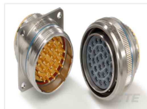
TE 产品编号 ZPF0000000000007174 983-ORS 08-98 PN