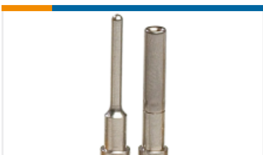
TE 产品编号 ZPF000000000001261 097-0267-16 A1267