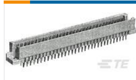
TE 产品编号650479-5 048 EURO TYPE R PIN ST ASSY