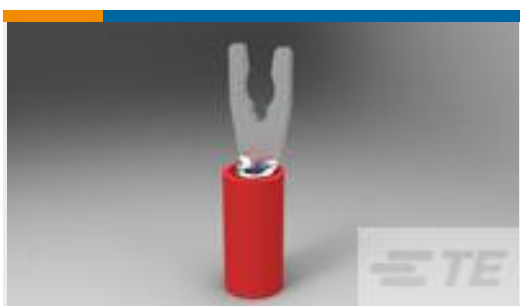
TE 产品编号8-52928-1 PIDG SP SPD 22-16COM22-18MIL 5