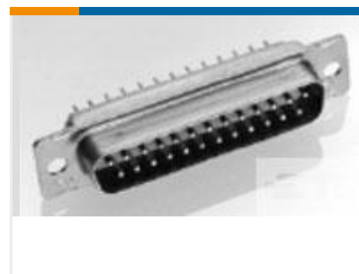
TE 产品编号1218124-1 9 POS,ASSY,PLUG,LOW PROF,109