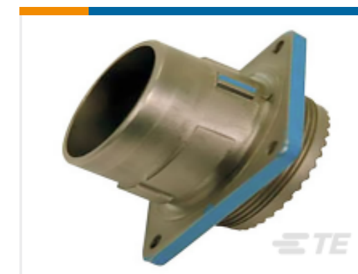
TE 产品编号YDIV46E23-35PAC009 PLUG ASSY