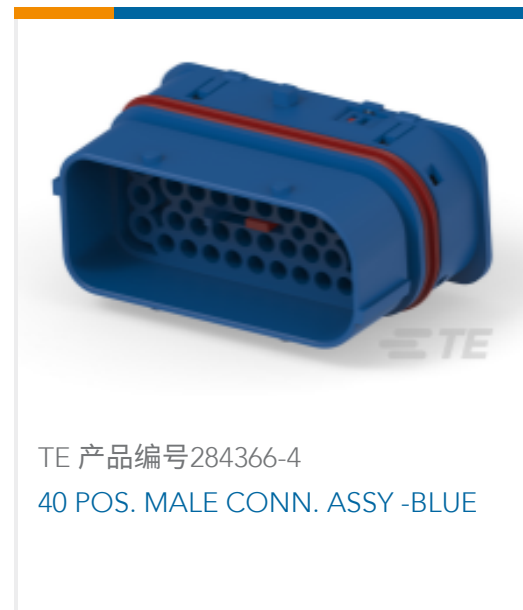
TE 产品编号284366-4 40 POS. MALE CONN. ASSY -BLUE