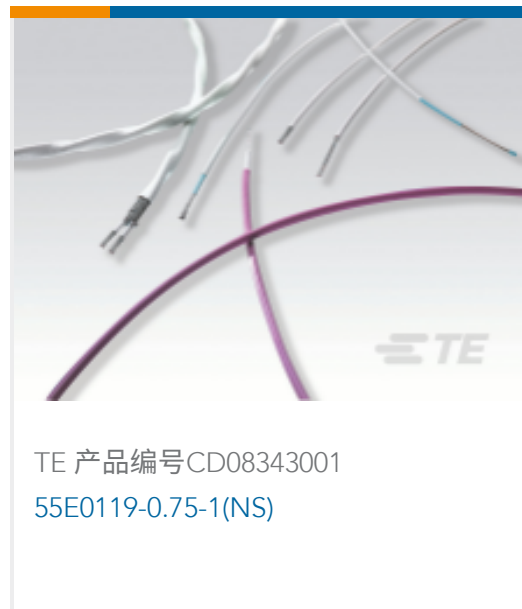
TE 产品编号CD08343001 55E0119-0.75-1(NS)