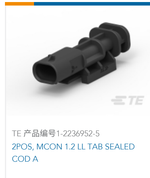
TE 产品编号1-2236952-5 2POS, MCON 1.2 LL TAB SEALED COD A