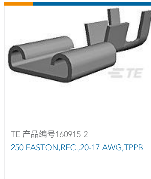
TE 产品编号160915-2 250 FASTON,REC.,20-17 AWG,TPPB