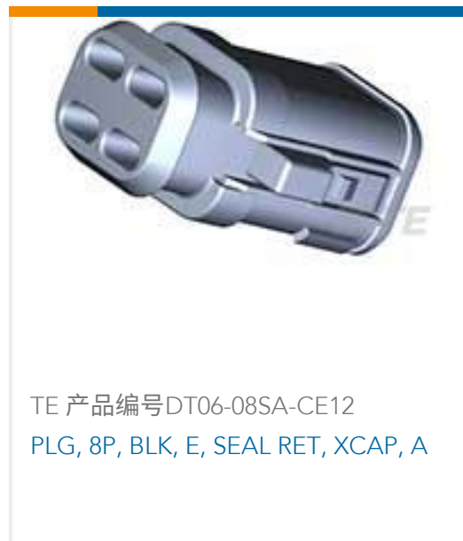
TE 产品编号DT06-08SA-CE12 PLG, 8P, BLK, E, SEAL RET, XCAP, A