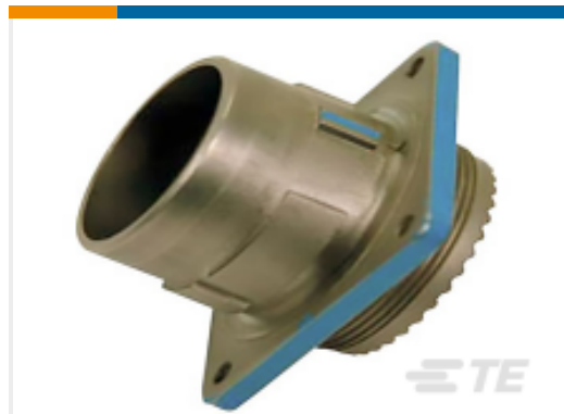
TE 产品编号YDIV46E13-98SNC009 PLUG ASSY