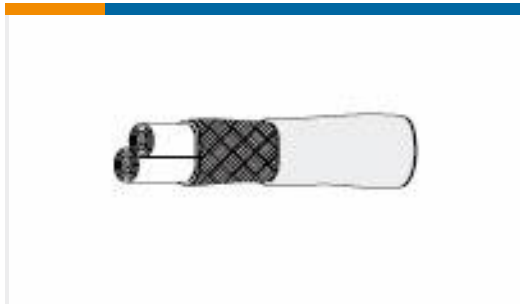
TE 产品编号439444-001 55A1132-22-0/2/9-9