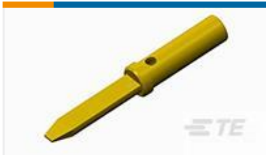
TE 产品编号226335-000 CTA-0166