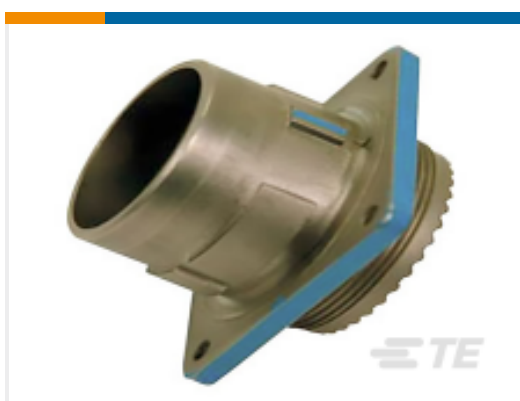
TE 产品编号YDIV46E25-19SCC009 PLUG ASSY