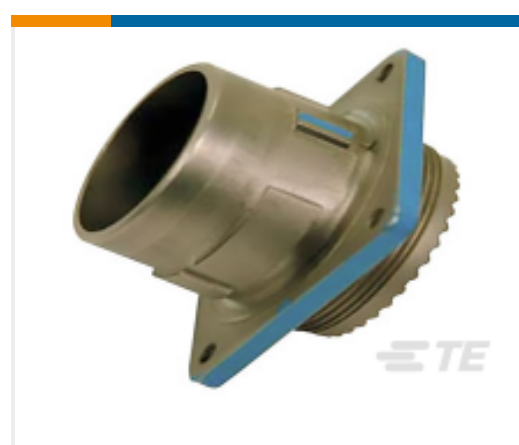
TE 产品编号YDIV46E21-11SBC009 PLUG ASSY