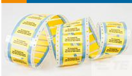
TE 产品编号7385170001 TMS-SCE-1K-1/2-2.0-9