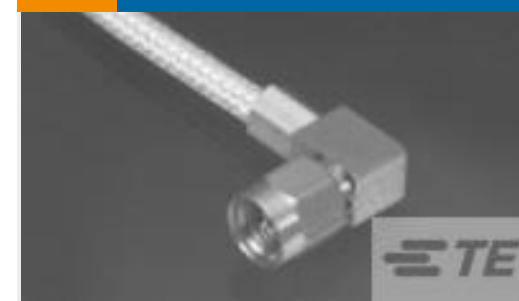
TE 产品编号1052098-1 2037 5100 02