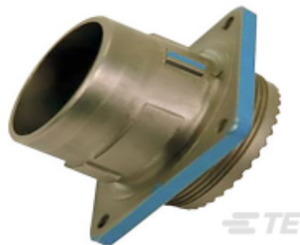
TE 产品编号YDIV46E13-98SNC009 PLUG ASSY