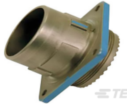
TE 产品编号YDIV46E25-35SNC009 PLUG ASSY