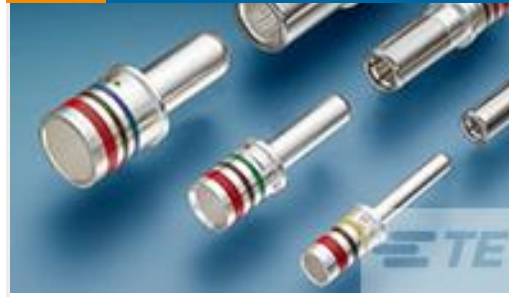
TE 产品编号0660-206-0482 CONT PIN