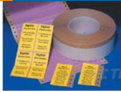
TE 产品编号097370-000 TTVF200YW-100