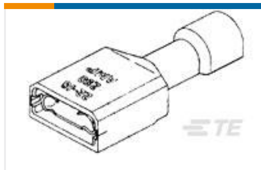
TE 产品编号2-520084-2 ULTRAFast 110 ASSY REC 22-18 TPBR LP