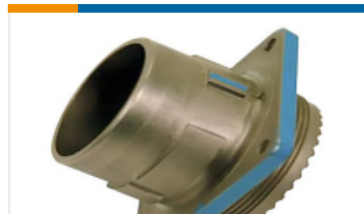
TE 产品编号YDIV46E17-26PNV001 PLUG ASSY