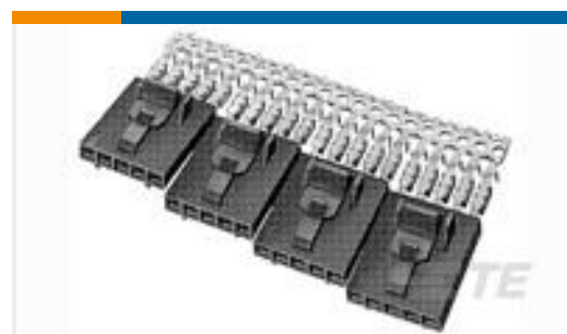
TE 产品编号5-103956-4 4X5 MTE RCPT SR LATCH .100CL