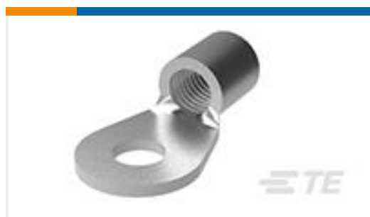
TE 产品编号36925 TERMINAL,SOLIS R 2/0 1/2