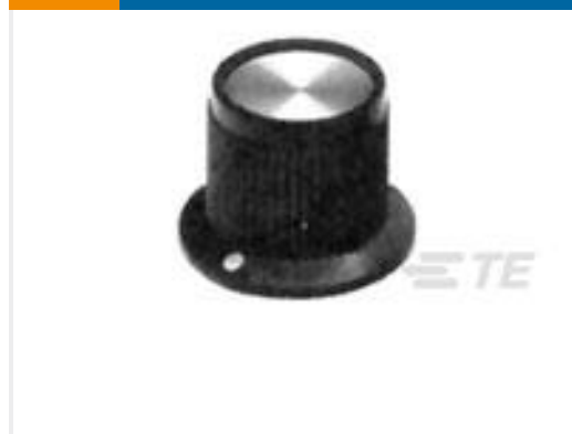
TE 产品编号1437624-6 PK50B1/4=KNOB PLASTIC BLK 1/4