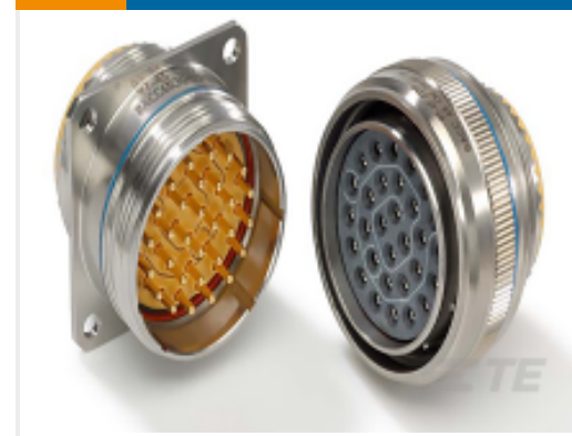
TE 产品编号ZPF000000000105544 983-0YE 12-03 PN TRA