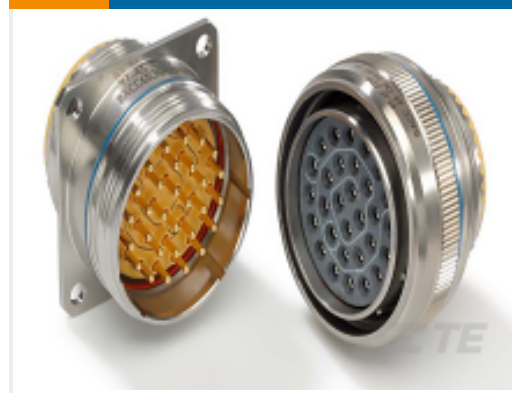
TE 产品编号ZPF000000000007856 983-0YE 12-03 PN