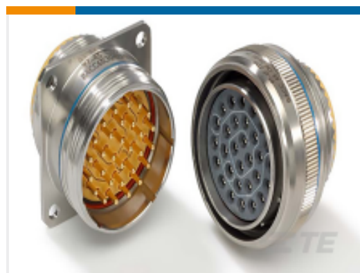
TE 产品编号ZPF0000000000007819 983-0Y 12-12 PN