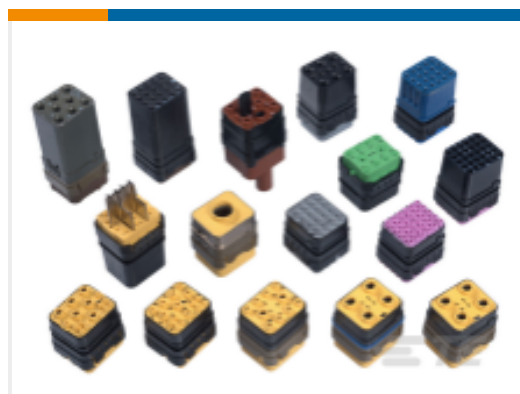
TE 产品编号ZPF0000000000015241 DMC-M 08-16 SN