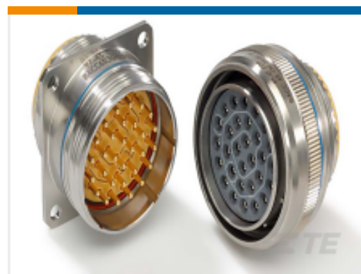
TE 产品编号ZPF0000000000008418 983-6RS 12-12 PN