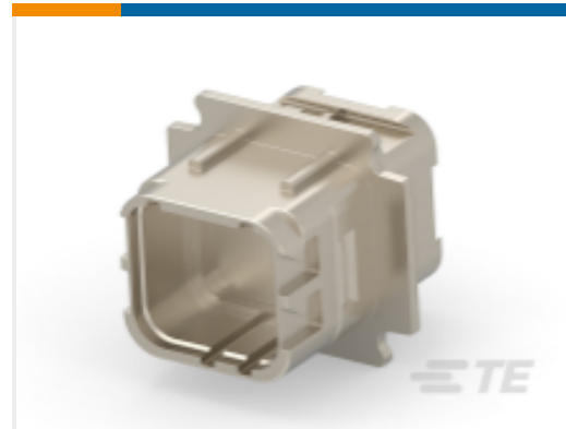
TE 产品编号ZPF000000000146192 DMC-MD 26 D-K-T