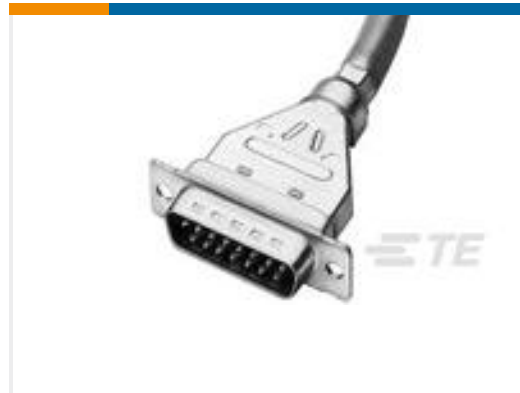
TE 产品编号1658652-1 KIT,HDP-20,OVRMLD,PLUG,SIZE 5,