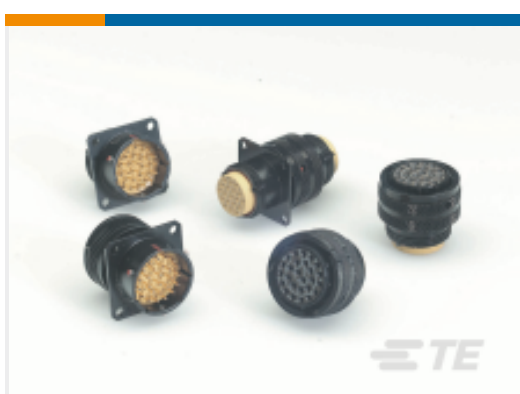
TE 产品编号ZPF0000000000018750 FDBA 50H 16-26 PW-K-A276A