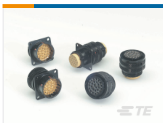
TE 产品编号ZPF0000000000018795 FDBA 53H 10-6 PN-K