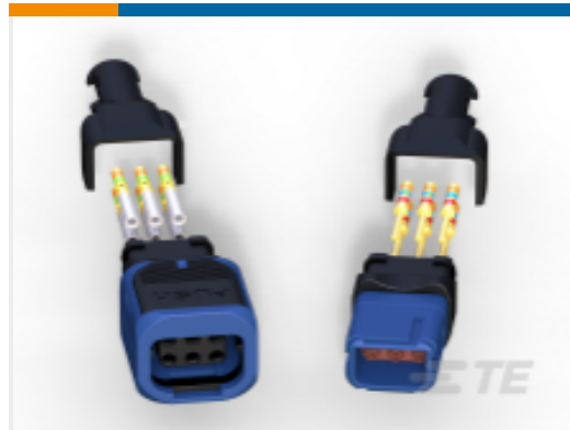
TE 产品编号YD369-P66-BS000000 369 6 WAY PLUG, NO CONTACTS, SKT