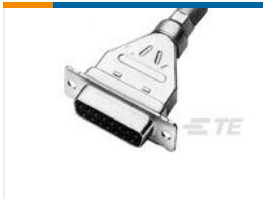
TE 产品编号1658649-1 KIT,HDP-20,OVRMLD,RCPT,SIZE 3,