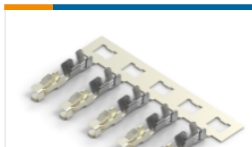
TE 产品编号5-2316113-5 2MM,REC,CNT,CRIMP,24-28AWG,0.76 UM,APPL