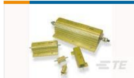
TE 产品编号1625984-5 HSA50 10R 5%