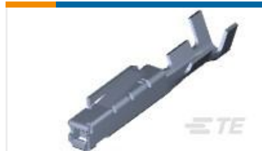
TE 产品编号1318108-1 DYNAMIC D-2000 REC CONT S L/P