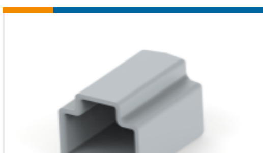
TE 产品编号DTM3S-DC PROTECT CVR, 3P, PLG, GRY, DTM