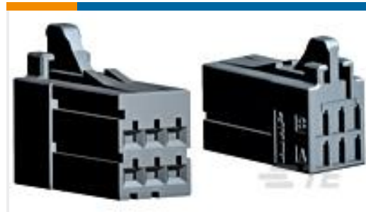
TE 产品编号1-1318119-3 DYNAMIC D-2100 REC HSG 6P