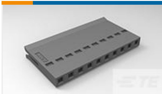
TE 产品编号487378-7 008 HOUSING FFC RCPT 100CL SR