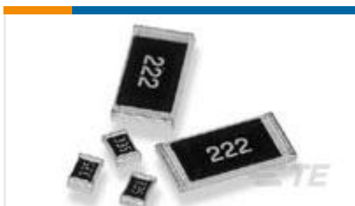
TE 产品编号1623094-1 CRG0603 ZEROHM