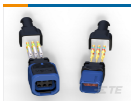
TE 产品编号 YD369-P33-BS000000 369 3 WAY PLUG, NO CONTACTS, SKT