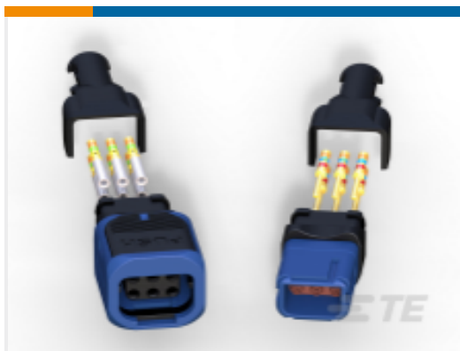
TE 产品编号YD369-P33-BS000000 369 3 WAY PLUG, NO CONTACTS, SKT