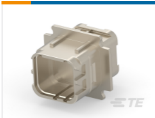
TE 产品编号ZPF00000000146309 Rectangular Connector Receptacle Extenders, Tool-less Assembly