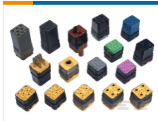
TE 产品编号ZPF00000000148762 DMC-M 99-04 AN (=33537-P0000)