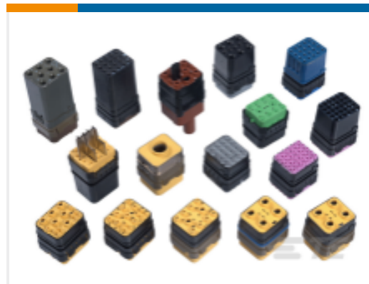
TE 产品编号ZPF00000000148762 DMC-M 99-04 AN (=33537-P0000)