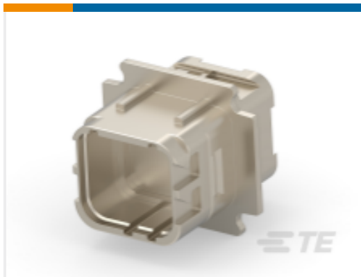
TE 产品编号ZPF00000000146309 Rectangular Connector Receptacle Extenders, Tool-less Assembly