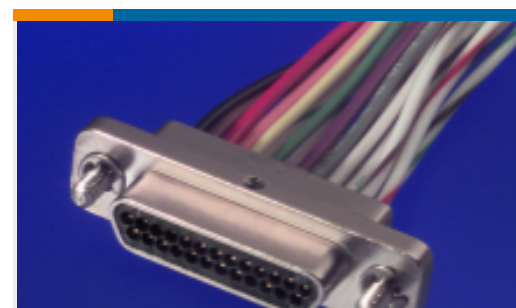
TE 产品编号2-1532171-5 M83513/04-A09C, MCKS-C2-B-9S6Q1-18.0