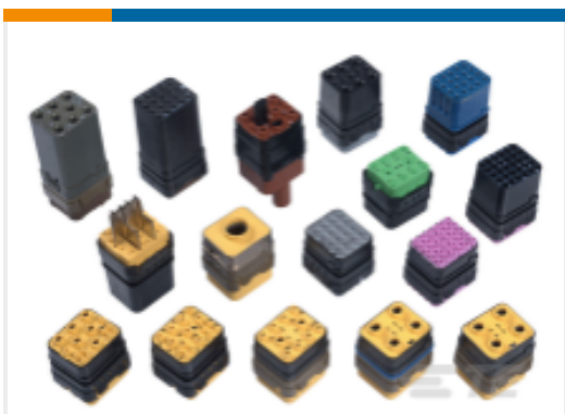
TE 产品编号ZPF00000000015262 DMC-M 12-20 BN