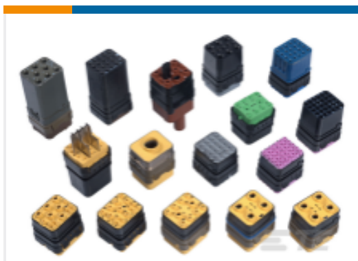
TE 产品编号ZPF00000000015254 DMC-M 12-20 AN