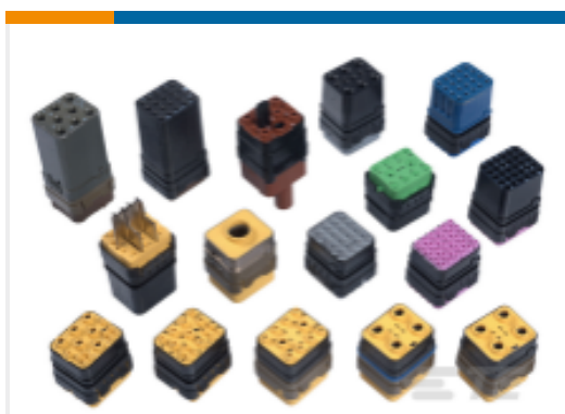
TE 产品编号ZPF00000000015299 DMC-M 20-22 BN