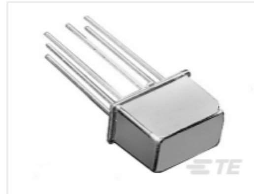
TE 产品编号 1617147-5 JMGAP-26P = M39016/17-030P