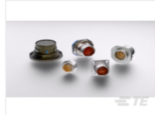
TE 产品编号 YDTS20Y13-98XNV001 HERM RECP