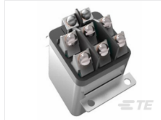
TE 产品编号 1617807-5 FC-335-SY8= RELAY, 3PST