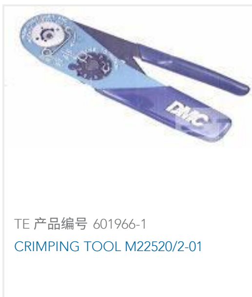
TE 产品编号 601966-1 CRIMPING TOOL M22520/2-01