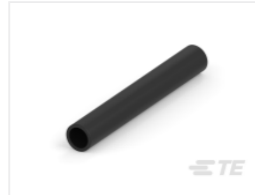
TE 产品编号 CAT-HST-BSTS BSTS/BSTS-FR 热缩管