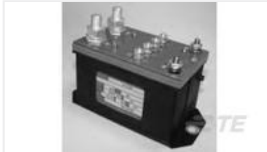
TE 产品编号 1616058-6 A703CD (FAA/PMA)=RELAY