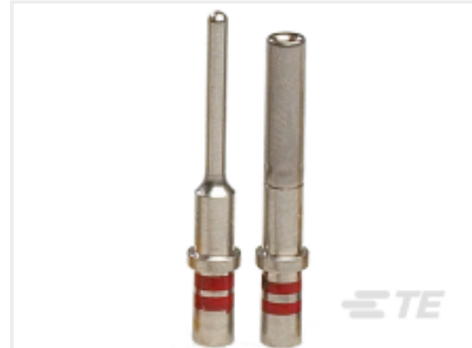
TE 产品编号 ZPF000000000001261 097-0267-16 A1267