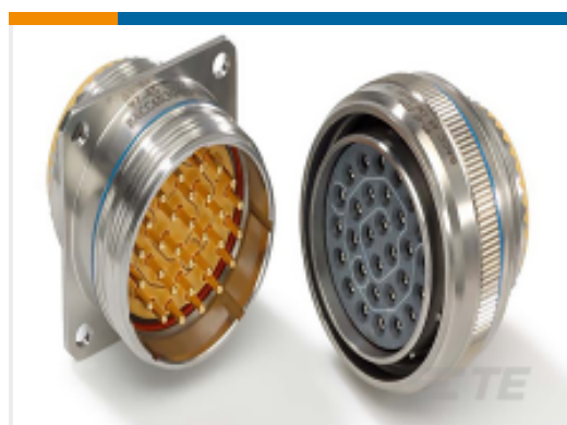
TE 产品编号ZPF0000000000007174 983-ORS 08-98 PN