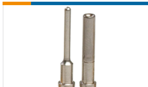
TE 产品编号ZPF000000000001261 097-0267-16 A1267