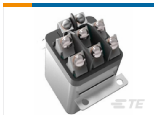
TE 产品编号1617807-5 FC-335-SY8= RELAY, 3PST