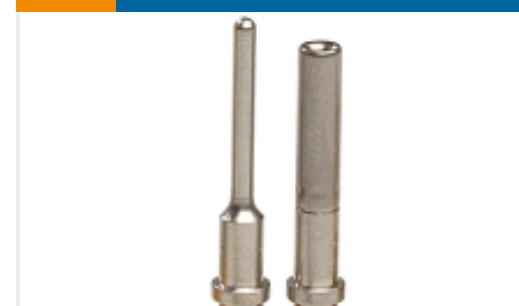
TE 产品编号ZPF000000000001261 097-0267-16 A1267