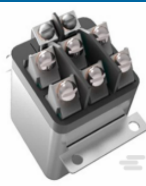
TE 产品编号ZPF0000000000007174 983-0RS 08-98 PN