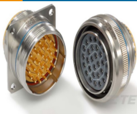
TE 产品编号358279-000 382C312-50-01-0