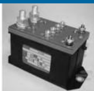
TE 产品编号1616058-6 A703CD (FAA/PMA)=RELAY