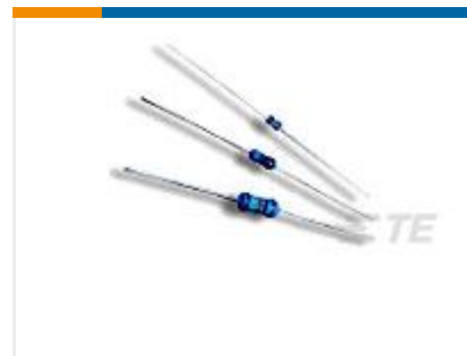
TE 产品编号1622765-1 LR2 1% 56R