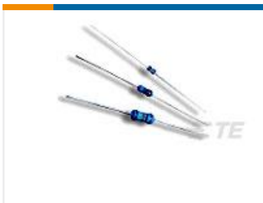
TE 产品编号1622763-1 LR2 1% 560R