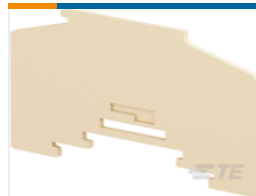
TE 产品编号1SNA295429R2600 SCHD2