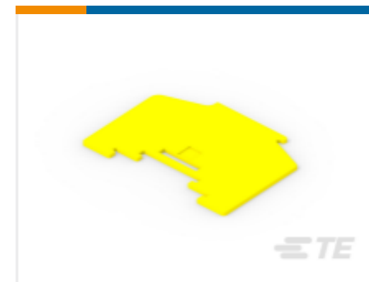
TE 产品编号1SNA205429R0400 SCHD2