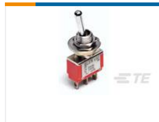
TE 产品编号3-1825136-6 A101SD9V30B04