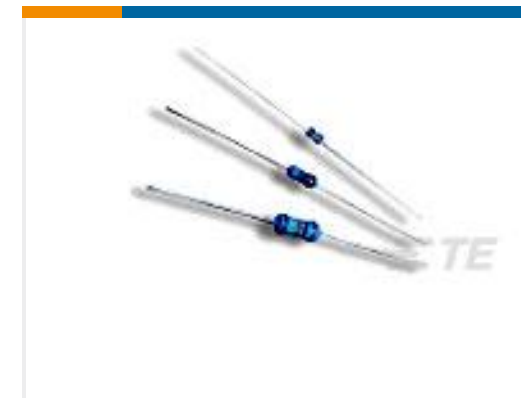
TE 产品编号1622692-1 LR2 1% 160K