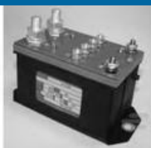
TE 产品编号1616058-6 A703CD (FAA/PMA)=RELAY