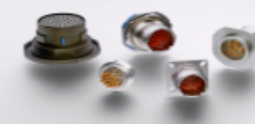
TE 产品编号YDTS20Y13-98XNV001 HERM RECP