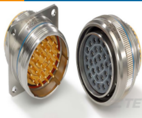
TE 产品编号358279-000 382C312-50-01-0