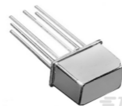
TE 产品编号1617147-5 JMGAP-26P = M39016/17-030P