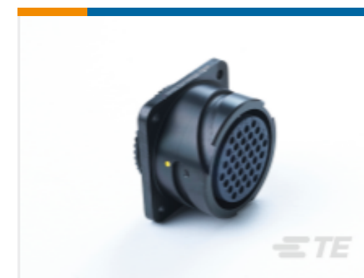
TE 产品编号Y5015-000000100122 FIXED SOCKET CONNECTOR