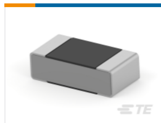
TE 产品编号2-1879132-6 RN 0402 16K5 0.1% 10PPM 1K RL