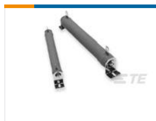
TE 产品编号1-1879456-0 TE 2000W 5R6 5% Bracket