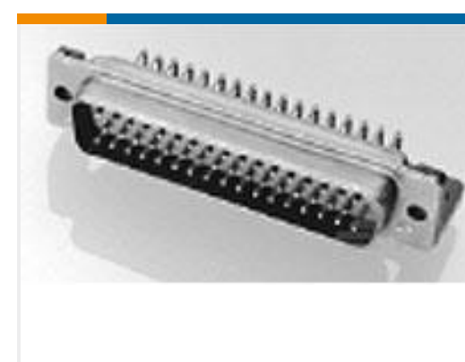
TE 产品编号1218442-1 R/A PLG ASSY 9 POS SER 109