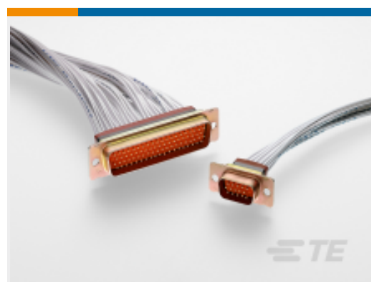
TE 产品编号2221760-5 AMPLIMITE IP67, SZ5, 90, 78 POS, RCPT