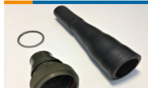
TE 产品编号639179-000 4024-00-130008