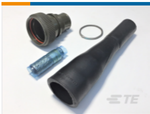
TE 产品编号842723N001 3016-10-340812-CS2359