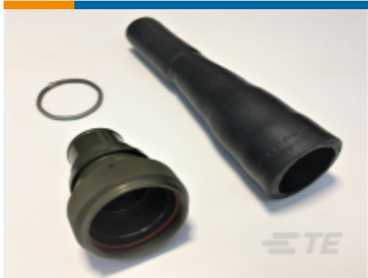
TE 产品编号639179-000 4024-00-130008