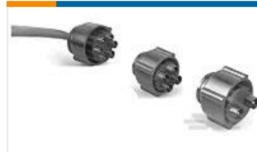
TE 产品编号860267-1 LGH-6 PIN HV PLUG ASY