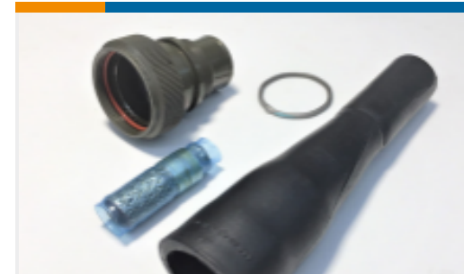
TE 产品编号842723N001 3016-10-340812-CS2359