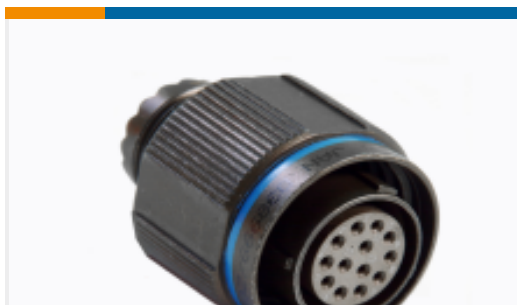
TE 产品编号YDTS26T13-08PNV001 PLUG ASSY