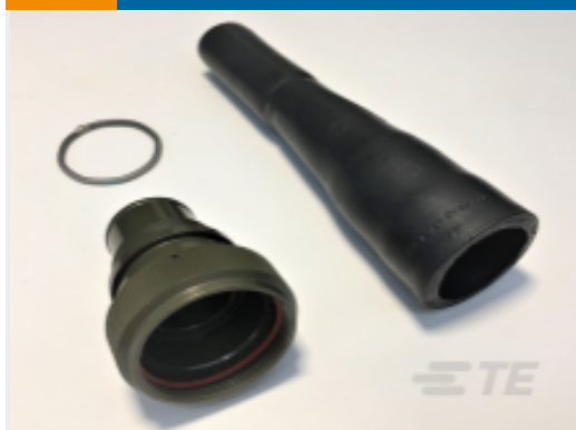
TE 产品编号639179-000 4024-00-130008