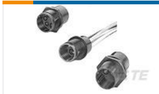
TE 产品编号859527-1 LGH RECEPT., FLANGED, H.V.