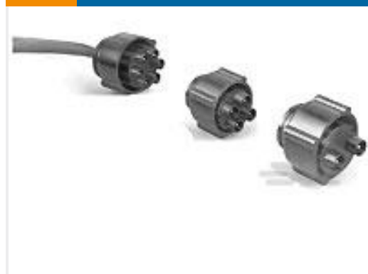
TE 产品编号861648-9 HV PIN PLUG ASSY