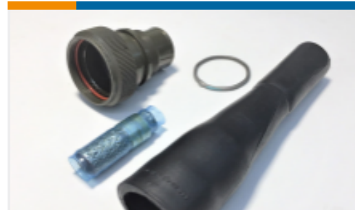
TE 产品编号212545N001 3022-10-441016-CS2359