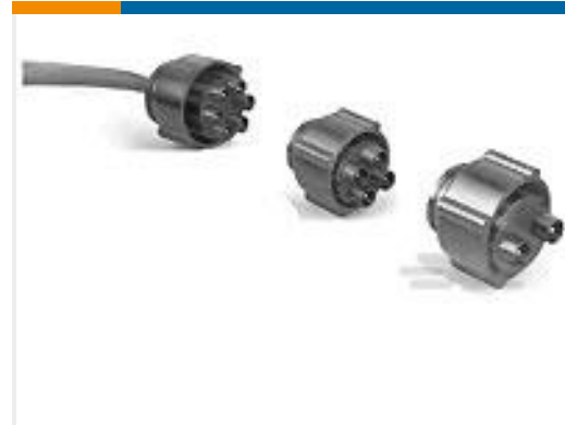
TE 产品编号861648-9 HV PIN PLUG ASY