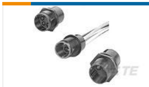
TE 产品编号859527-1 LGH RECEPT., FLANGED, H.V.