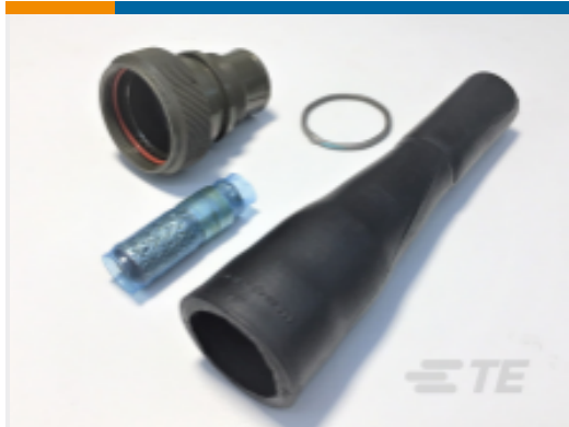
TE 产品编号212545N001 3022-10-441016-CS2359