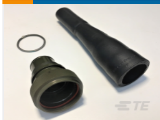
TE 产品编号639179-000 4024-00-130008