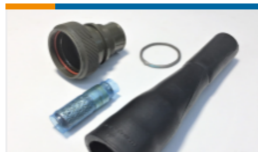
TE 产品编号842723N001 3016-10-340812-CS2359