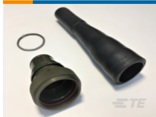
TE 产品编号639179-000 4024-00-130008