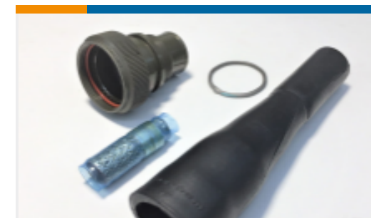
TE 产品编号212545N001 3022-10-441016-CS2359