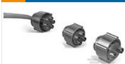
TE 产品编号861648-9 HV PIN PLUG ASY