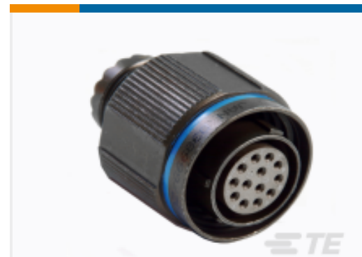
TE 产品编号YDTS26T13-08PNV001 PLUG ASSY