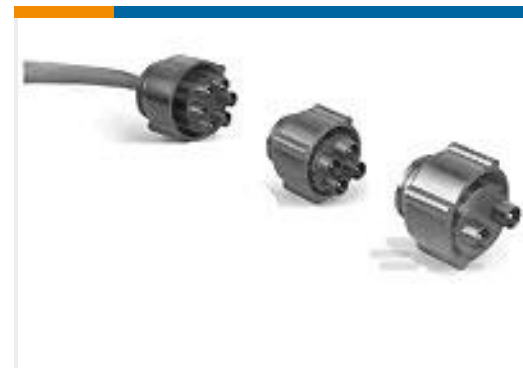
TE 产品编号861648-9 HV PIN PLUG ASSY