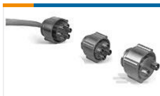
TE 产品编号860267-1 LGH-6 PIN HV PLUG ASSY