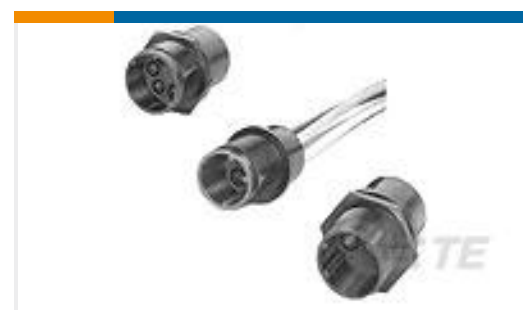
TE 产品编号859527-1 LGH RECEPT., FLANGED, H.V.