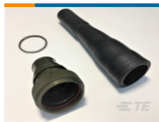
TE 产品编号639179-000 4024-00-130008