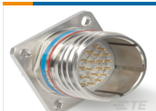
TE 产品编号YDTS20G21-11PCV001 RECP ASSY