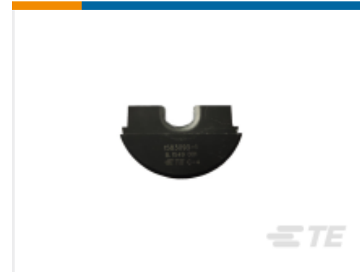
TE 产品编号1-1490413-6 NEST, 90 DEG SOLISTRAND, 4