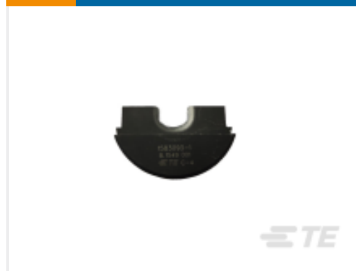
TE 产品编号1-1490413-8 NEST, 90 DEG SOLISTRAND1/0