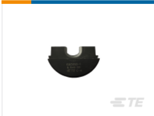
TE 产品编号1-1490413-8 NEST, 90 DEG SOLISTRAND1/0