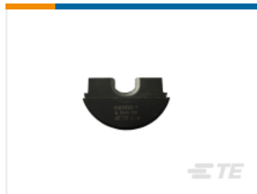
TE 产品编号1-1490413-6 NEST, 90 DEG SOLISTRAND, 4