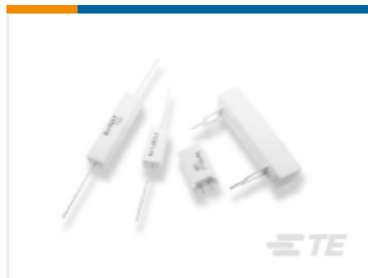
TE 产品编号1623795-9 线绕电阻器：水平安装