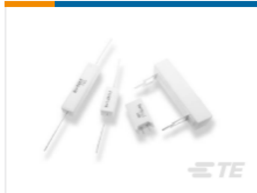
TE 产品编号1623795-9 线绕电阻器：水平安装