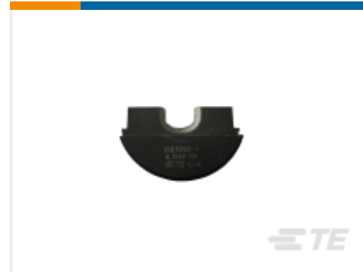
TE 产品编号1-1490413-6 NEST, 90 DEG SOLISTRAND, 4